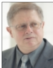
Dr. Klaus W. Lippold

Winfried Hermann ( LL Baden-Württemberg ) Peter Hettlich ( LL Sachsen ) Dr. Anton Hofreiter *) ( LL Bayern ) Stellvertreter B90/DIE GRÜNEN: Kerstin Andreae ( LL Baden-Württemberg )