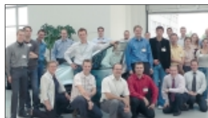
Begeistert: Die Teilnehmer am Workshop.

Die Abschlusspräsentation machte auf der technischen Seite deutlich, dass Brennstoffzellenfahrzeuge zunehmend alltagstauglich werden.