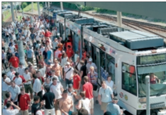
Der VDV meldete für die gesamte Laufzeit der WM über 30 Millionen zusätzliche Fahrgäste für Busse und Bahnen.

Berlin - Die Fußball-Weltmeisterschaft 2006 stellte insgesamt eine Ausnahme-situation für die Mobilität in Deutschland dar, die sich zu jedem Spiel rund um die Austragungsorte und dazu überall in den Innenstädten durch den Zu- und Ablauf zu den Fan-Festen als Treffpunkte der internationalen Gästeschar mit deutlich erhöhten Fahrgastzahlen zeigte. So meldete der VDV für die gesamte Laufzeit der WM über 30 Millionen zusätzliche Fahrgäste für Busse und Bahnen, die zusätzlich zum normalen Tagesgeschäft befördert wurden. Zwei Millionen Ticketinhaber seien bei den 64 Spielen der WM mit Bussen und Bahnen zu den Stadien gefahren, mehr als 60 Prozent der Sta-