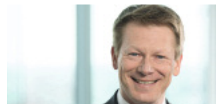
Dr. Richard Lutz , Vorsitzender des Vorstands, Deutsche Bahn AG